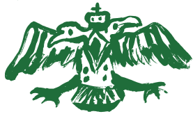
Рисунок на пуговице подскажет, кто её хозяин. Найди в витрине № 3 предмет с похожим рисунком и догадайся: